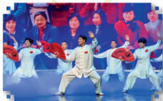
市政人的幸福生活